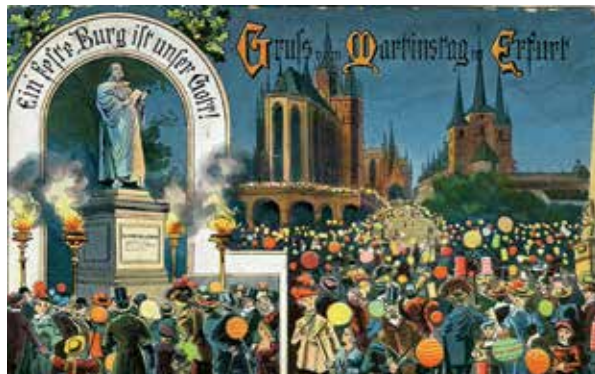
Szent Márton-napi üdvözlőlap az 1910-es évekből

A liba mellcsontjának megfigyeléséből jósltak az időjárásra: ha a csont hosszú és fehér, akkor havas, ha barna és