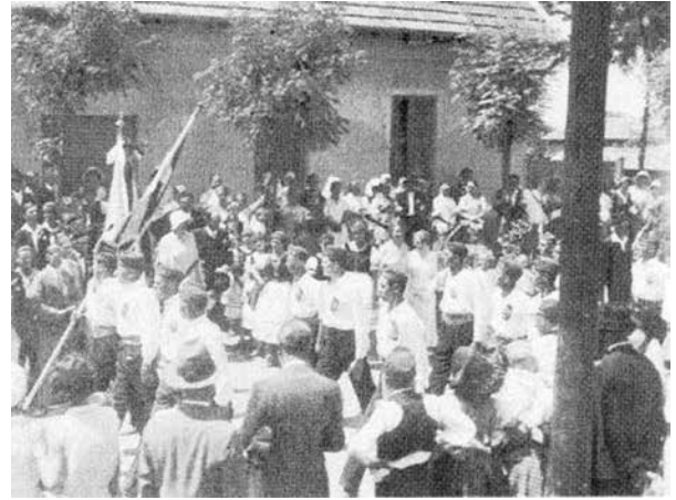
A Petőfi Dalkör zászlóavató ünnepségén felvonultak a levették is 1935-ben (Horváth Lajos: Csömör története, Kiadja: Csömör Nagyközség Önkormányzatának Képviselő-testülete, 2000)

A képeket szkennelés után visszajuttatjuk a tulajdonosnak! Jelentkezéseket várjuk a helyiujsag@gmail.com címen!