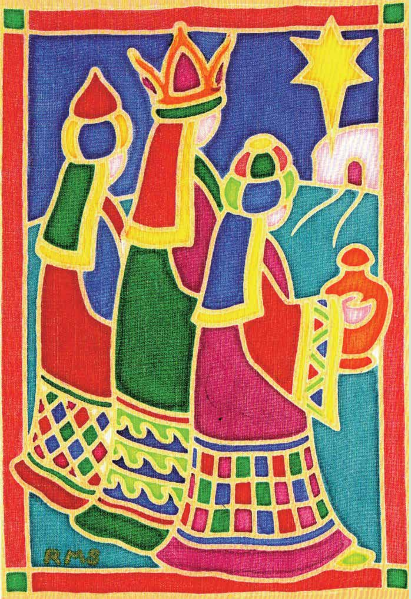
Napkeleti bölcsek (szájjal festette: Rosie Moriarty-Simmonds; kapcsolódó cikkünk a 3. oldalon)